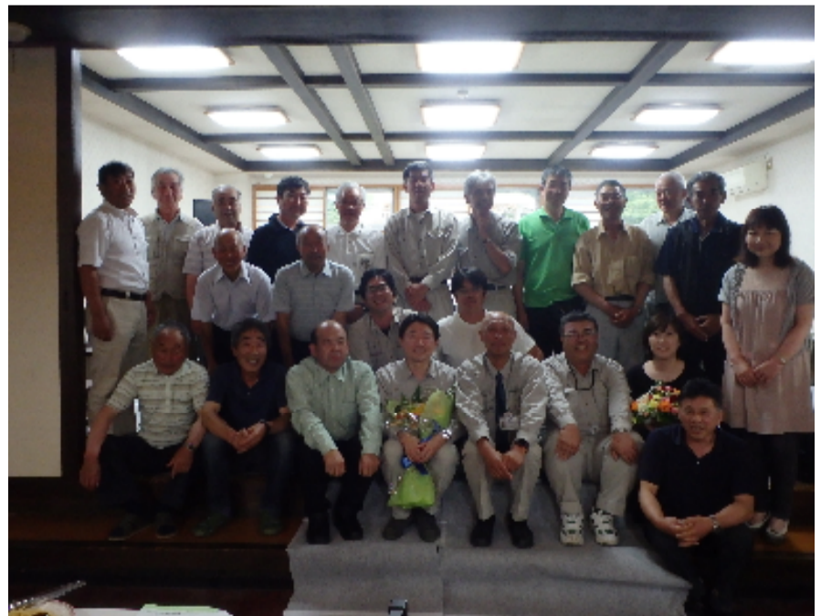
地元の方々主催の送別会の状況写真